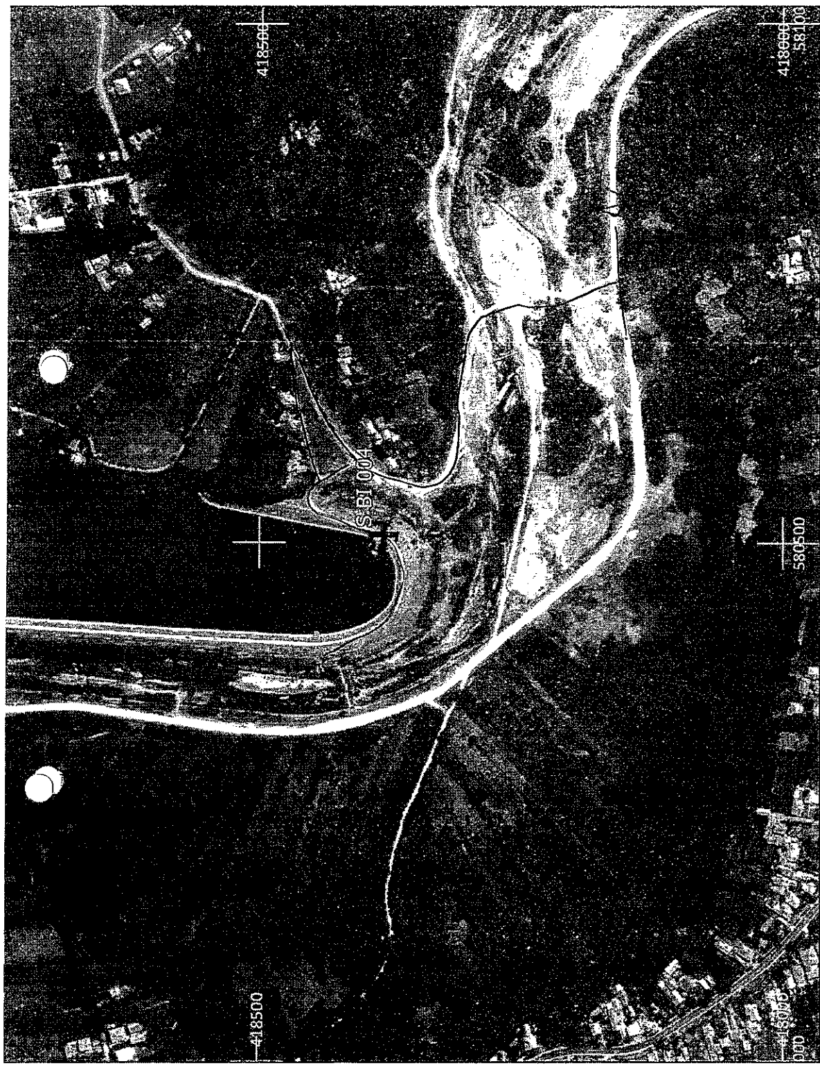
Amplasament sirenă - Faza HCL