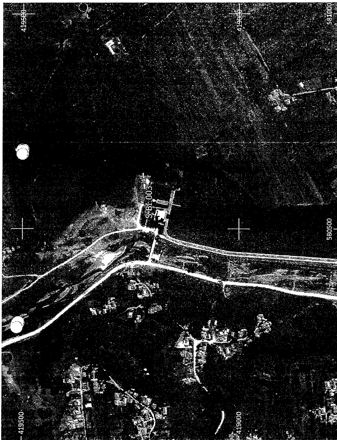
Amplasament sirenă - Faza HCL